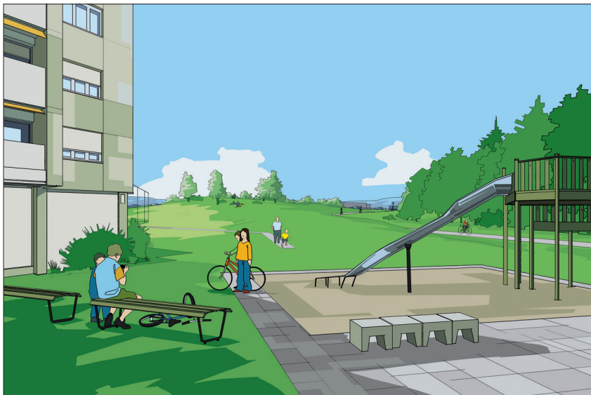
Überdeckte A5 in den Weidteilen. Blick vom Heideweg in Richtung Portstrasse. (Illustration: Simon Müller)